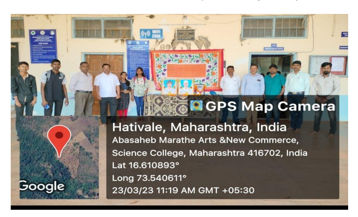
Observe Shahid Din