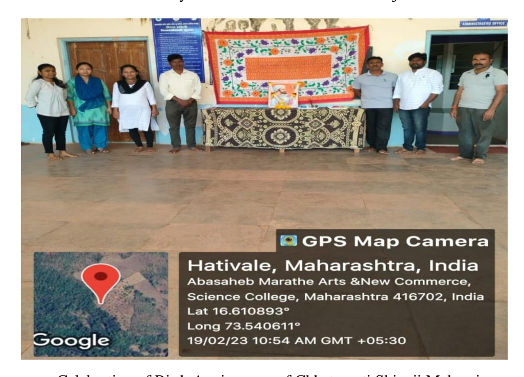
Celebration of Birth Anniversary of Chhatrapati Shivaji Maharaj