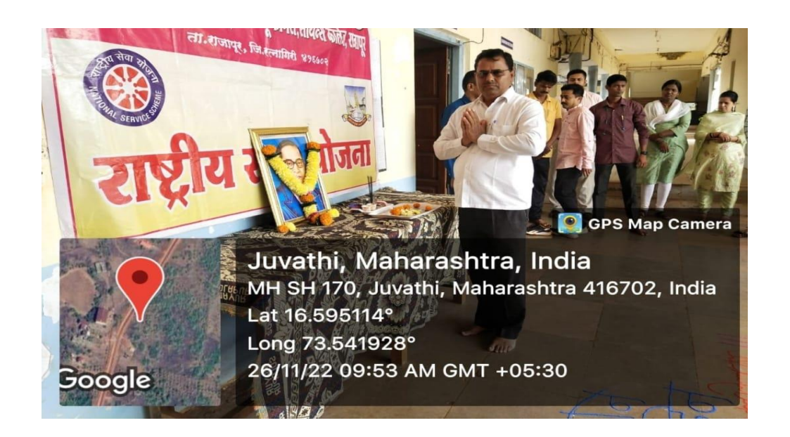
Celebration of Constitution Day