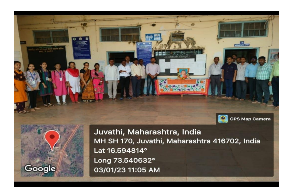
Celebration of Savitribai Phule Birth Anniversary